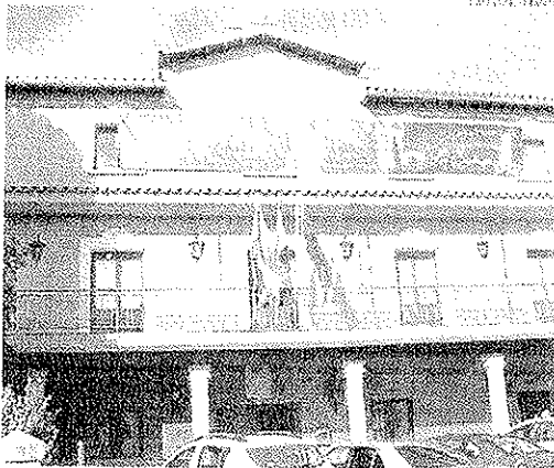
▶ Fachada principal del Ayuntamiento de Jarandilla de la Vera

En este sentido añadió que este compromiso lo adquirimos al comienzo de la presente legislatura, en el que aseguramos que todo el dinero incluido en los planes Activa de Diputación, lo estamos empleando en el geriátrico. Esto motiva que muchos proyectos no se puedan llegar a realizar, pero quiero que entiendan los vecinos, que nuestro objetivo es terminar la residencia